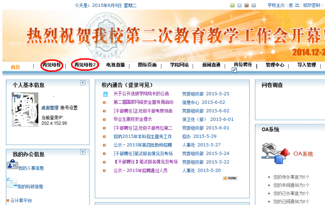
图 1-1 数字化校园

浏览器下输入上面的数字化校园地址,输入用户名、密码、验证码登录,进入数字化校园页面。如图 1-1 所示,点击左上方“再见母校”或“再见母校2”进入离校系统(图 1-2 所示)。(两个连接随机选择一个即可)