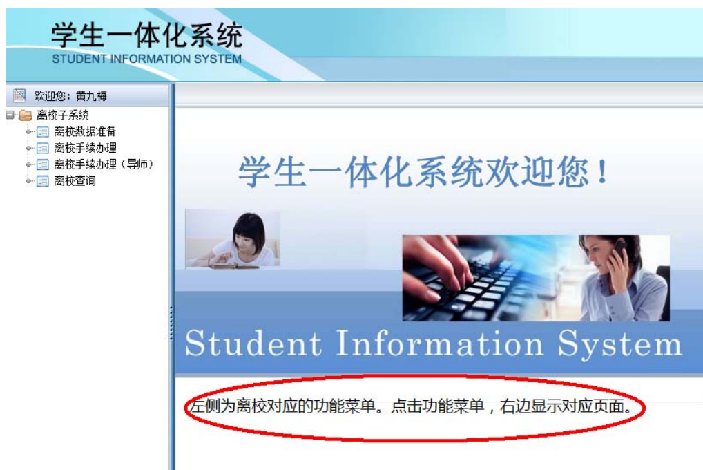
图 1-2 离校系统