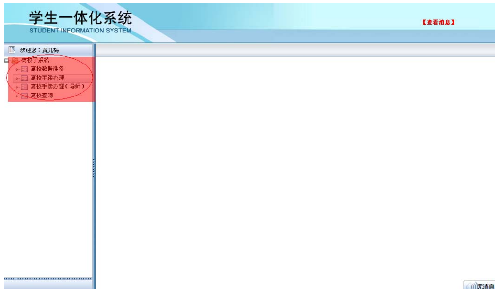
图 1-2 离校系统