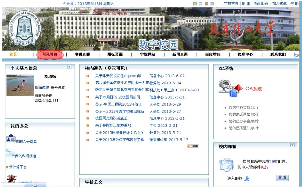
图 1-1 数字化校园

浏览器下输入上面的数字化校园地址,输入用户名、密码、验证码登录,进入数字化校园页面。如图 1-1 所示,点击“再见母校”进入离校系统(图 1-2 所示)。